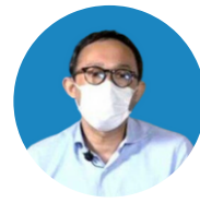
Santa Firmansjah LIXIL